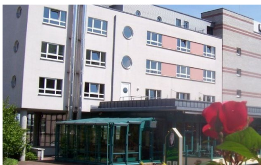
Ringhotel Katharinen Hof, Unna