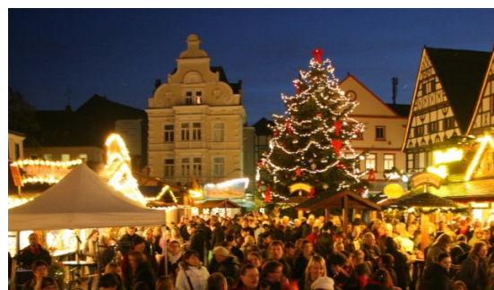
Weihnachtsmarkt in Unna